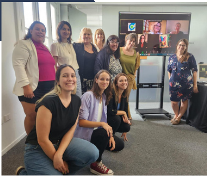
Participación en el Foro regional CGD de las Américas 11 de marzo - Santo Domingo, República Dominicana

Diálogo crucial sobre el futuro democrático de América Latina, Realizado por la REDLAD en asociación con Global Democracy Coalition.