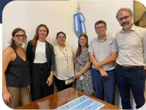
Conversatorio sobre “La realidad de Nicaragua”, coorganizada junto a la Red por la Verdad y La Libertad 22 de febrero