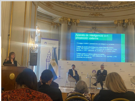
Conferencia Freedom Matters: En defensa del libre mercado, Argentina y la amenaza del socialismo del siglo XXI 25 de abril

Diálogo crucial sobre el futuro democrático de América Latina, Realizado por LibertyPlus y FIU .